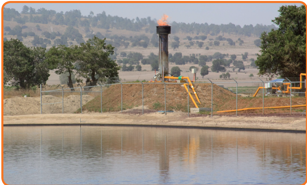
Nuestros procesos sustentables son parte fundamental de la evaluación realizada por el Cemefi .

Granjas Carroll fue la primera industria porcicultora del país en recibir este distintivo en 2007, y año con año logra refrendar este posicionamiento. En 2012, fue una de las 10 empresas veracruzanas y 15 poblanas que reciben el distintivo de un total de 684 empresas del país que se hicieron acreedoras al reconocimiento